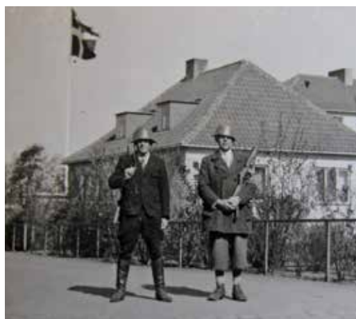
Frihedskæmpere foran Borup Skole

som havde sympatiseret med tyskerne. Skolen var derfor lukket en uges tid, så skolebørnene kunne ikke komme i skole. KR