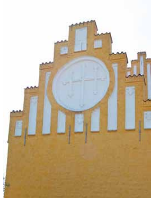
Korset på østgavlen af Nørre Dalby Kirke. Samme kors kan også ses på alterbordsforhænget i kirkens kor.